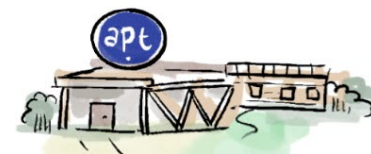
Bureaux de l'APT